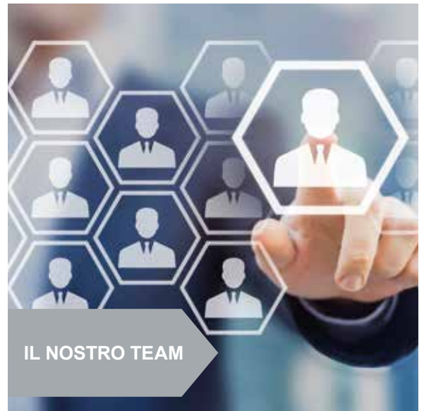
IL NOSTRO TEAM

L'offerta professionale si suddivide in 6 aree tematiche: Sicurezza, Antincendio, Formazione, Progettazione, Pubblicazioni, Consulenze Specialistiche.