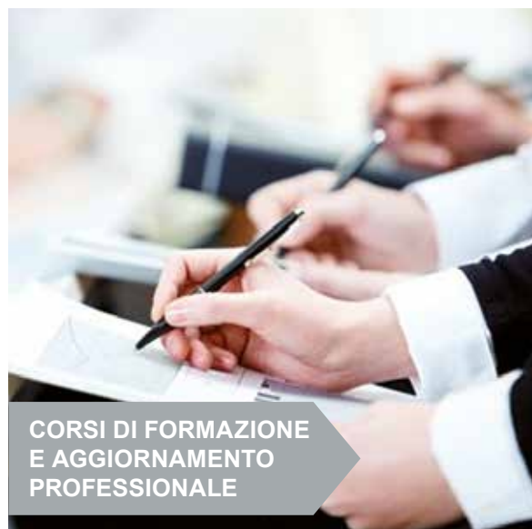
CORSI DI FORMAZIONE E AGGIORNAMENTO PROFESSIONALE