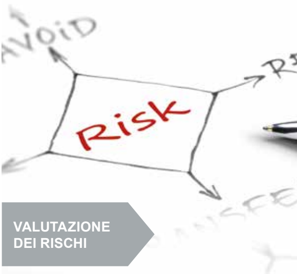
VALUTAZIONE DEI RISCHI

A seguire i nostri servizi: incarico RSPP esterno, Documento di Valutazione dei Rischi (DVR) ai sensi del D.Lgs. 81/08, Artt. 17, 28, di cui i seguenti Rischi Specifici (Rumore, Vibrazioni, Incendio, Atmosfere Esplosive - ATEX, Chimico, Movimentazione Carichi, Movimenti ripetuti, Sovraccarico Biomeccanico, Stress Lavoro-Correlato, ecc.), Documento Unico di Valutazione dei Rischi da Interferenze (DUVRI), Piano di Emergenza, Prove di Evacuazione, incarico CSP/CSE, POS, PSC ai sensi del Titolo IV, ecc.