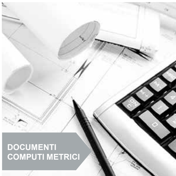
DOCUMENTI COMPUTI METRICI