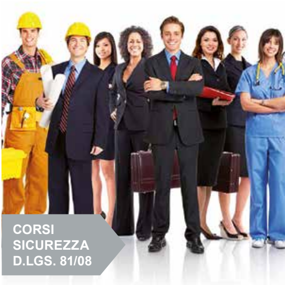
CORSI SICUREZZA D.LGS. 81/08

I nostri corsi di formazione e di aggiornamento professionale si rivolgono non solo a tutte le figure aziendali contemplate dal D.Lgs. n. 81/08, quindi ai RSPP/ASPP, Coordinatori della Sicurezza (CSP/CSE), Lavoratori, Preposti, Dirigenti, Rappresentanti dei Lavoratori per la Sicurezza (RLS), Addetti Antincendio e Addetti al Primo Soccorso, ma anche a Consulenti e Progettisti, Addetti alla manutenzione, tecnici aziendali, Rappresentanti degli Organi di Vigilanza, ecc. I corsi sono erogati in modalità frontale, ovvero in aula e/o in videoconferenza (streaming sincrono). In taluni casi potranno essere pianificate partnership con Ordini Professionali, Collegi, Associazioni/Istituzioni/Società accreditate, anche per l'erogazione in modalità e-learning (streaming asincrono). Si redigono accurati Piani Formativi sulla base delle reali esigenze dei Clienti, programmando ed offrendo soluzioni formative ad hoc finalizzate al conseguimento degli obblighi legislativi.