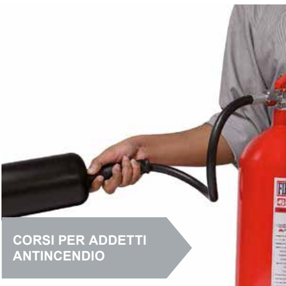
CORSI PER ADDETTI ANTINCENDIO

I nostri corsi di formazione e di aggiornamento professionale si rivolgono non solo a tutte le figure aziendali contemplate dal D.Lgs. n. 81/08, quindi ai RSPP/ASPP, Coordinatori della Sicurezza (CSP/CSE), Lavoratori, Preposti, Dirigenti, Rappresentanti dei Lavoratori per la Sicurezza (RLS), Addetti Antincendio e Addetti al Primo Soccorso, ma anche a Consulenti e Progettisti, Addetti alla manutenzione, tecnici aziendali, Rappresentanti degli Organi di Vigilanza, ecc. I corsi sono erogati in modalità frontale, ovvero in aula e/o in videoconferenza (streaming sincrono). In taluni casi potranno essere pianificate partnership con Ordini Professionali, Collegi, Associazioni/Istituzioni/Società accreditate, anche per l'erogazione in modalità e-learning (streaming asincrono). Si redigono accurati Piani Formativi sulla base delle reali esigenze dei Clienti, programmando ed offrendo soluzioni formative ad hoc finalizzate al conseguimento degli obblighi legislativi.